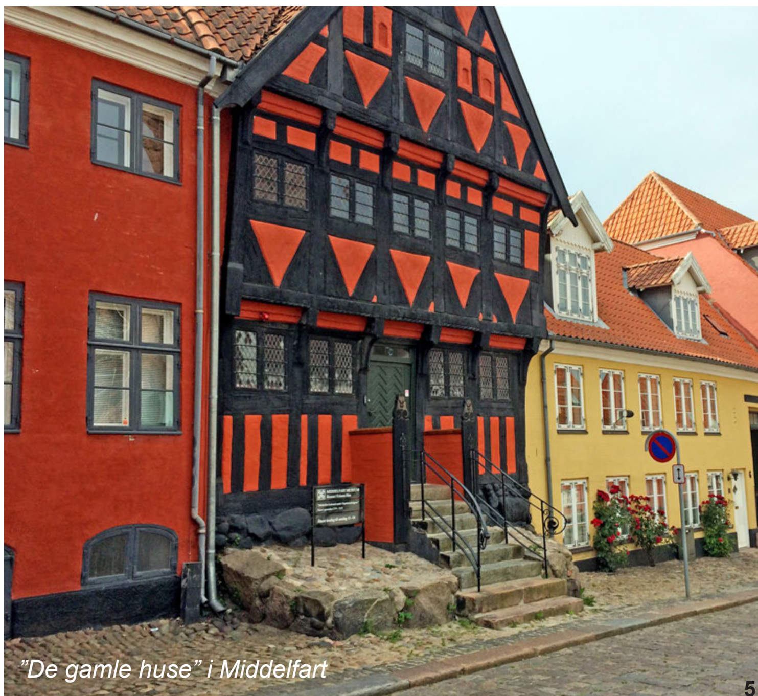
"De gamle huse" i Middelfart

Overfartssted. Som det smalleste sted mellem Jylland og Fyn, har området mellem Snoghøj og Middelfart været et vigtigt overfartssted siden Middelalderen. Alle kongerne i Danmarkshistorien har været her igennem. Hertuger og andre store folk ligeledes. Færgerne kaldes skibene, der bragte folk over. Så vi dem i dag, ville vi snarere kalde dem store joller. De havde sejl, men kunne også roes. Med vore øjne må det have været koldt og barsk at tage turen over i åben båd, og man forstår næppe, hvordan store læssede hestevogne, kareter eller en flok køer er kommet om bord. Bedre blev det i 1858, da der kom en dampskibsfærge.