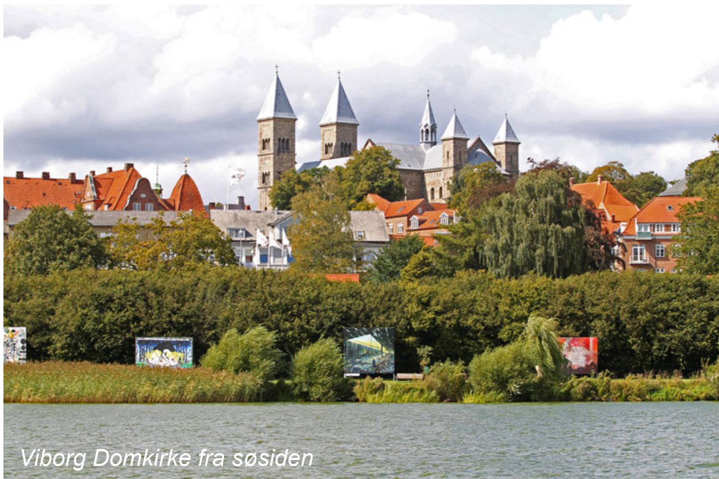
Viborg Domkirke fra søsiden

Afstande: Viborg C - Naturskolen v. Hald 9 km Thorning skole - Naturskolen, 18 km