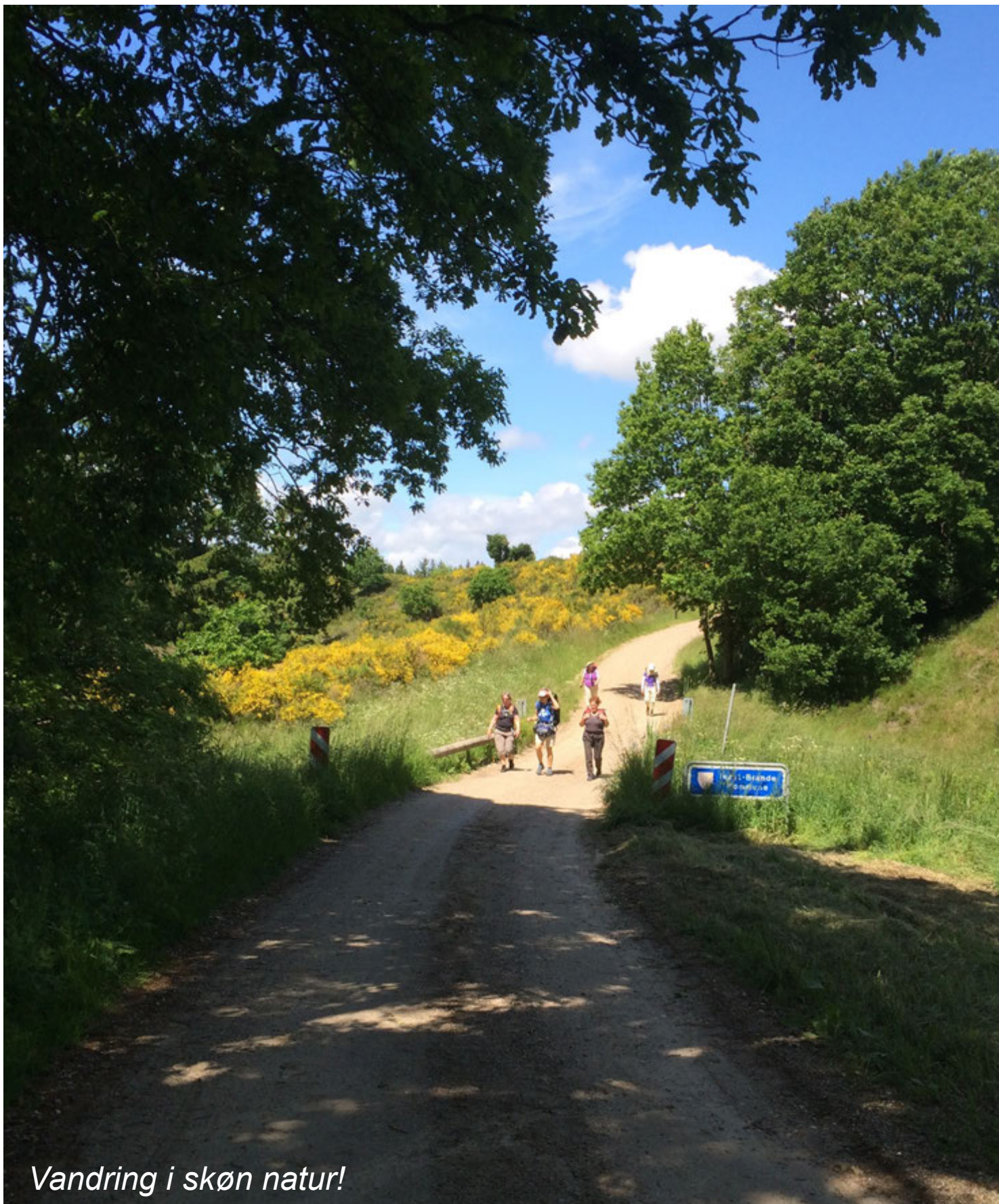
Vandring i skøn natur!